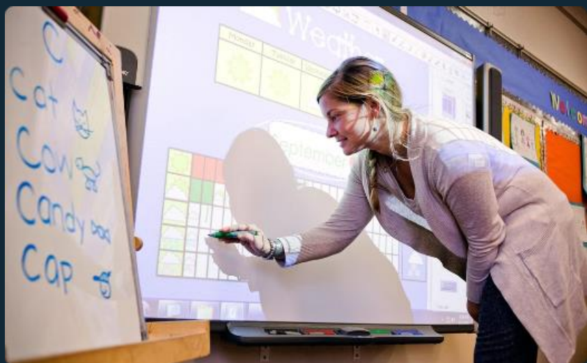
Phương pháp tương tác