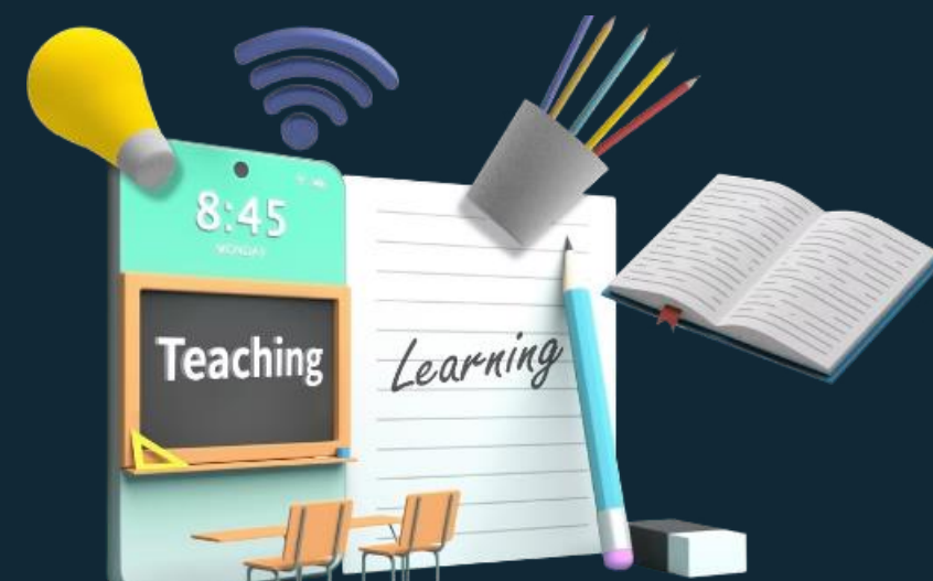
Phương pháp đa phương tiện